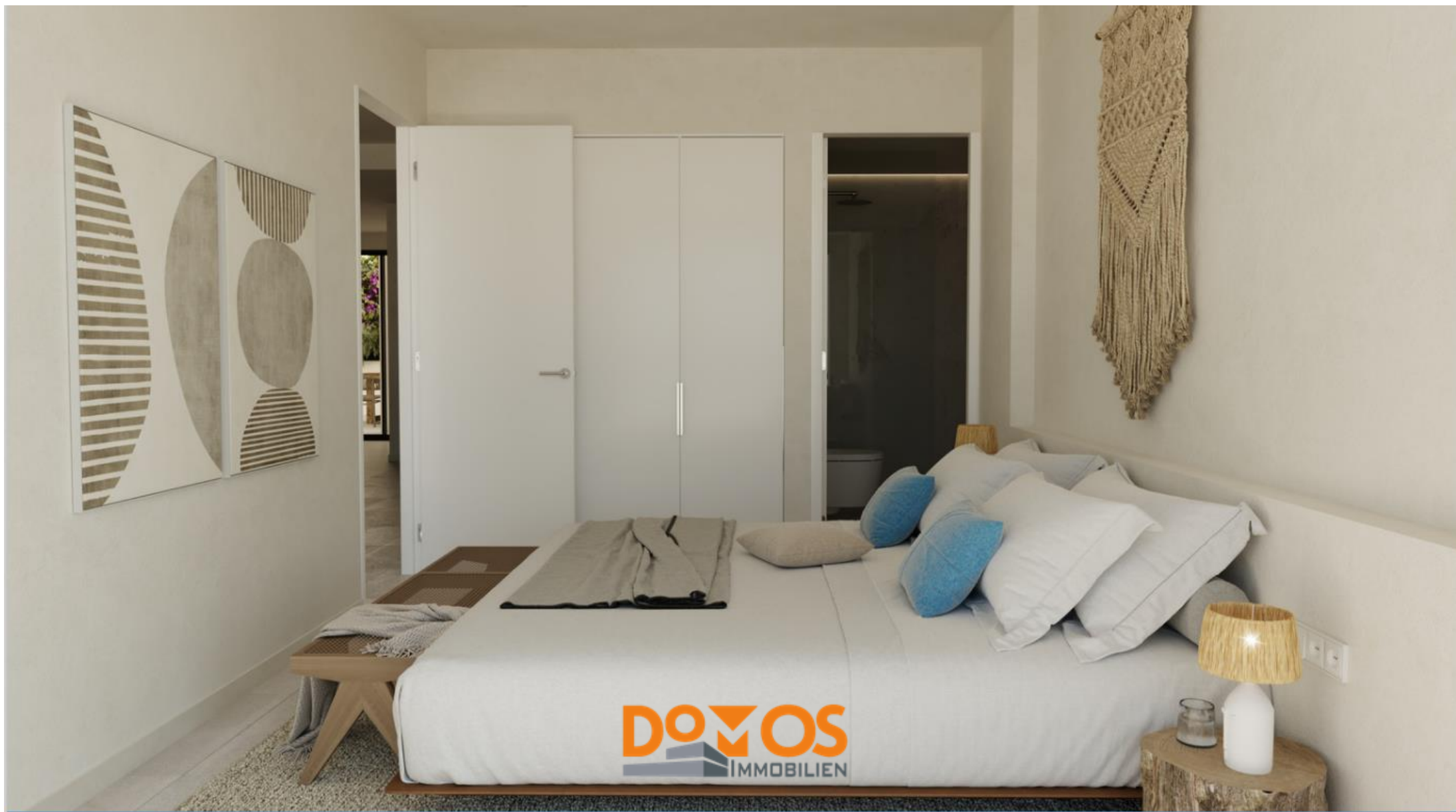
DomOS Immobilien, Waldstr. 13, 49086 Osnabrück