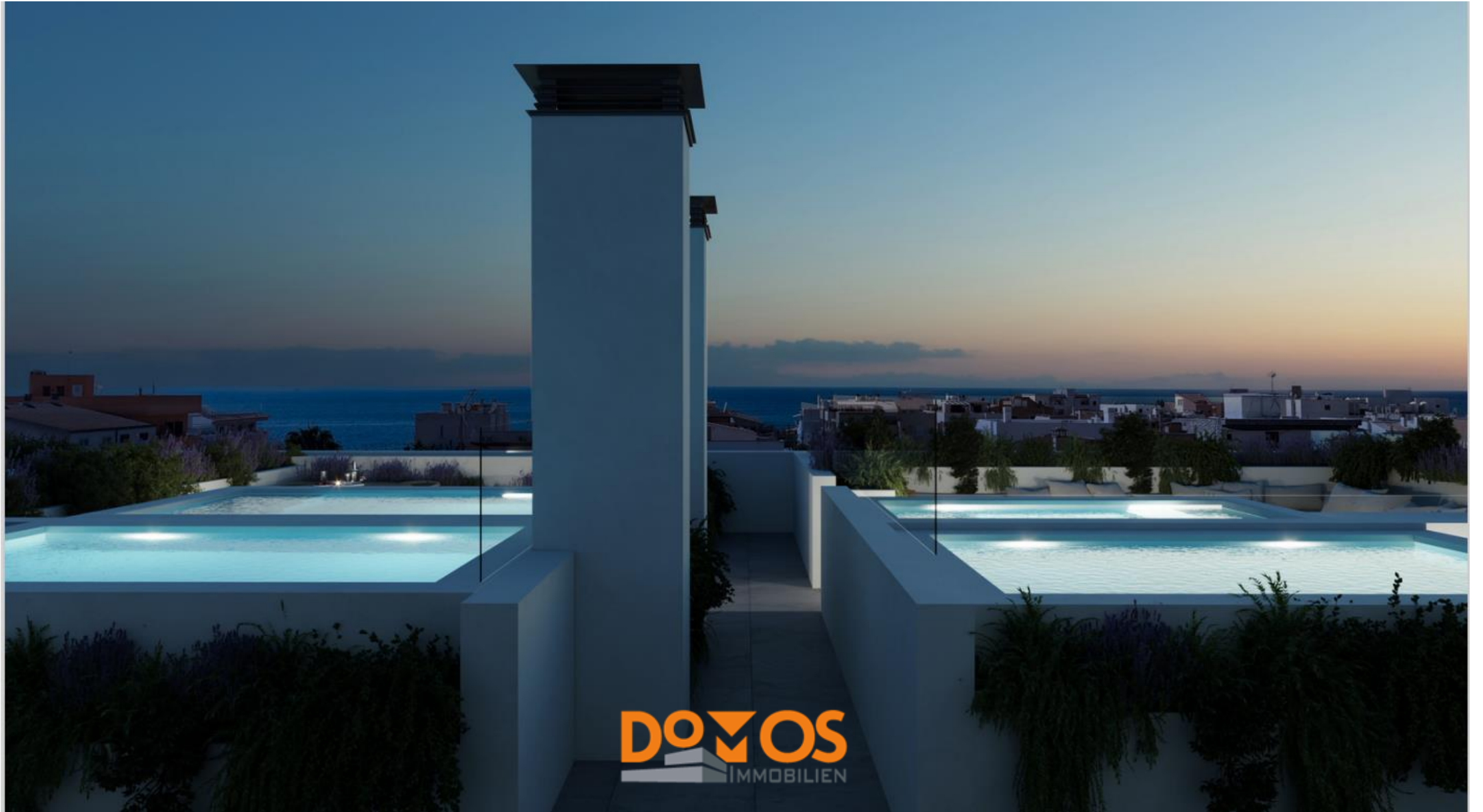
DomOS Immobilien, Waldstr. 13, 49086 Osnabrück