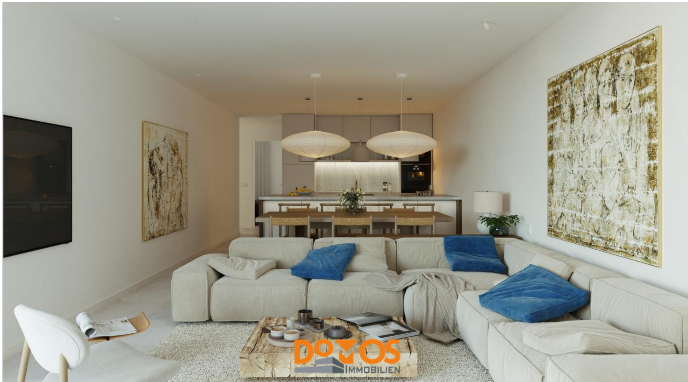
DomOS Immobilien, Waldstr. 13, 49086 Osnabrück