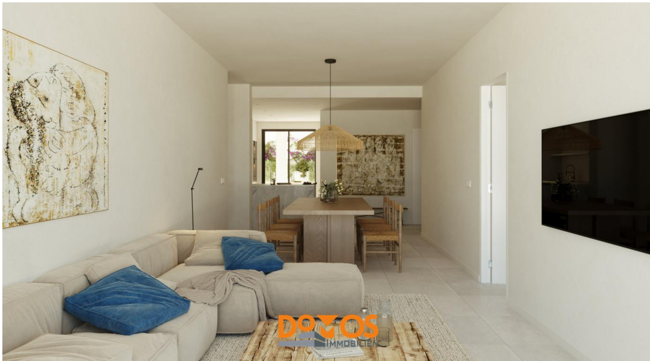
DomOS Immobilien, Waldstr. 13, 49086 Osnabrück